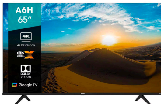
Pantalla LED Hisense 65" Ultra HD 4K Smart TV 65A6H sku: 277958